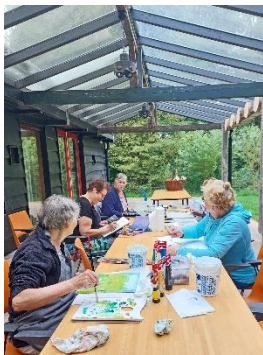
Enkele schilders in actie

IVN Laarbeek hoopt in de toekomst ook nog eens een tentoonstelling te organiseren van de schilderstukken en beelden die in deze groene omgeving gemaakt zijn.