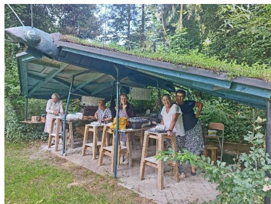
Het beeldhouwclubje onder de vlinder. Helaas was het mannelijk lid afwezig.

Toen enkele jaren geleden de KBO het pand van de scouting ging verlaten was dit een probleem voor de beeldhouwclub van de seniorenvereniging. Beeldhouwen doe je i.v.m. het stof en steenslag buiten. Waar vind je buiten voldoende onderdak om je hobby uit te oefenen? Toen het IVN van dit probleem hoorde is contact gezocht met het bestuur van de seniorenvereniging en als snel resulteerde dit in een oplossing waar beide partijen tevreden mee zijn. Nu hakken de senioren in de natuurlijke omgeving van het IVN-terrein onder de beschermende vleugels van een vlinder die ook door de jeugd gebruikt wordt voor wateronderzoek. Oud en jong samen onder één dak.