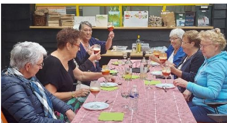
De afsluitende vakantie lunch bij het IVN